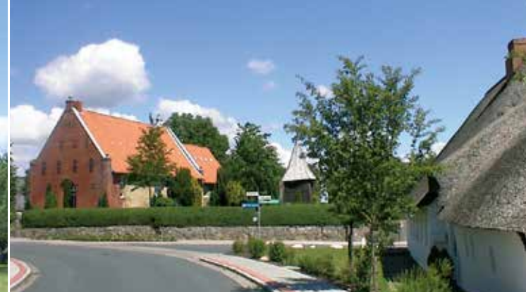
Historischer Dorfkern mit Kirche in Bargum