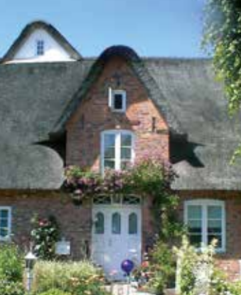
Reetdachhaus in Bargum