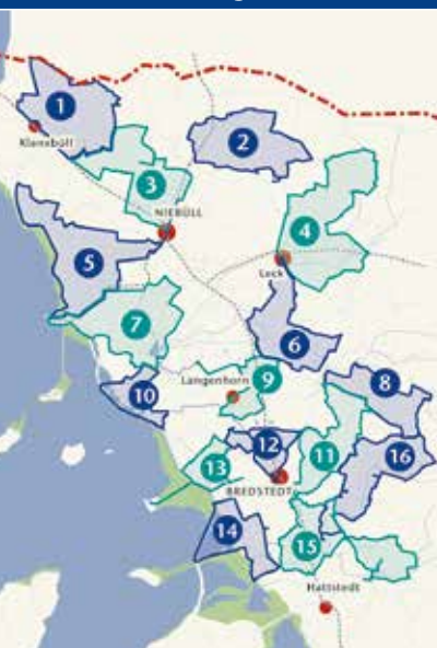
»Westermöhl« in Langenhorn

* schleswig-holstein Urlaub, so weit das Auge reicht!