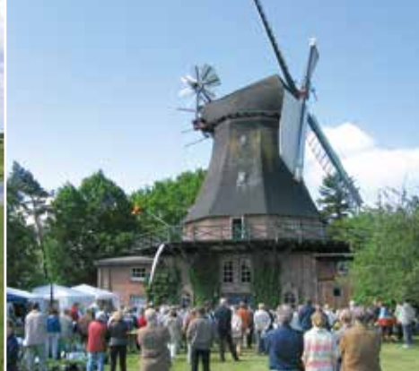
»Aeolus« in Bargum