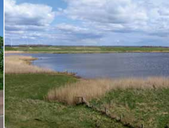
Die 'Große Wehle' am Deich der Hattstedter Marsch