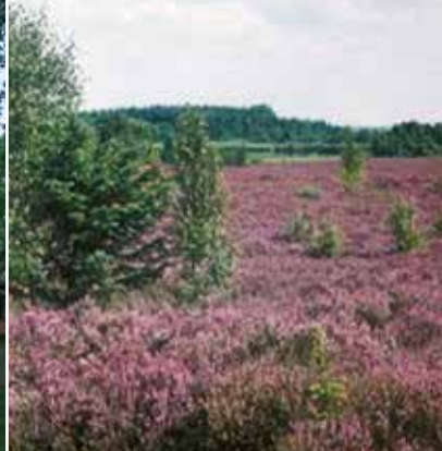
Bordelumer und Langenhorner Heide