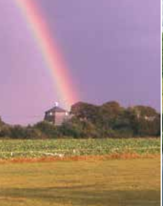
Petersburger Mühle in Drelsdorf